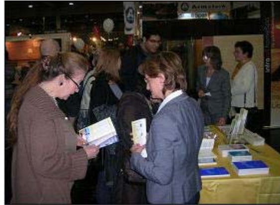
人们在法轮功学员的展位前详细了解功法 看个究竟,了解法轮功。

在法轮功学员的展位上,有法轮大法书籍和炼功音乐光碟,提供给来访者阅读并购买。法轮功学员穿着黄色炼功服,进行功法演示。祥和的功法和悠扬的音乐,吸引了众多参观者到展位前