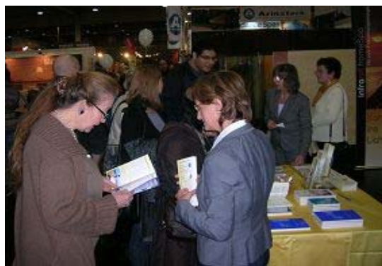
人们在法轮功学员的展位前详细了解功法

（明慧记者郑晴奥地利报道）奥地利的文化城格拉茨于二零一零年一月八日至九日召开了为期两天的健康博览会。奥地利法轮功（又称法轮大法）