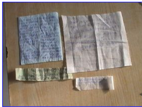
图：从马三家劳教所辗转传出几份法轮功学员写的被迫害的信件