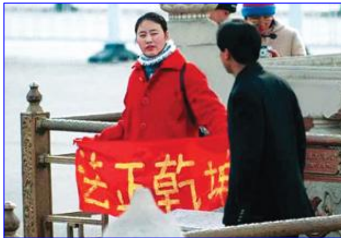
图：一名女法轮功学员在天安门广场和平请愿

我问教授：宪法讲信仰自由，法轮功有没有信仰自由，炼法轮功信“真善忍”有没有错呢？答：没错。我又问：警察半夜三更的把许多炼法轮功的人（其中有很多老头、老太太）抓起来，然后按个“罪名”送去劳教所、监狱，甚至打死，这样做对不对呢？他默认不对。我又问：既然这样不对，那么法轮功有没有说话的权利呢？他觉得应该有说话的权利。我又问：既然法轮功有说话的权利，那么人们为什么不反省共产党的错误政策，反而指责法轮功告诉人们的事实真