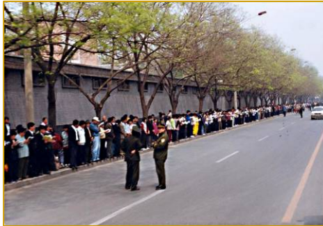
秩序井然的“四二五”上访民众

然而江泽民集团为迫害法轮功，蓄意把“四二五”和平理性的依法上访歪曲成“围攻中南海”，在国内外大肆诬陷宣传，混淆视听迷惑民众。但是由于共产党的专政历来被国际