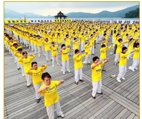
为制止迫害 台湾法轮功学员在日月潭畔集体炼功、讲真相

这样的例子在台湾数不胜数，在世界各地都屡见不鲜，由此可见，中共野蛮的迫害和诽谤，根本无法阻挡法轮功在全世界的弘扬，迄今十二年来，法轮功传遍世界一百多个国家和地区，受到不同族裔各阶层民众的喜爱，法轮功的主要著作《转法轮》被译成三十多种文字在全世界发行。中共的残酷迫害并没有打倒法轮功学员，法轮功更在反迫害中屹立不摇，并蓬勃发展。◇