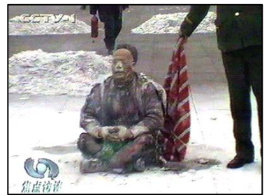
图: “自焚”演员的坐姿也露出破绽, 虽然其做了手势模仿, 但两腿为军人坐姿, 并非法轮功学员的盘腿姿势。