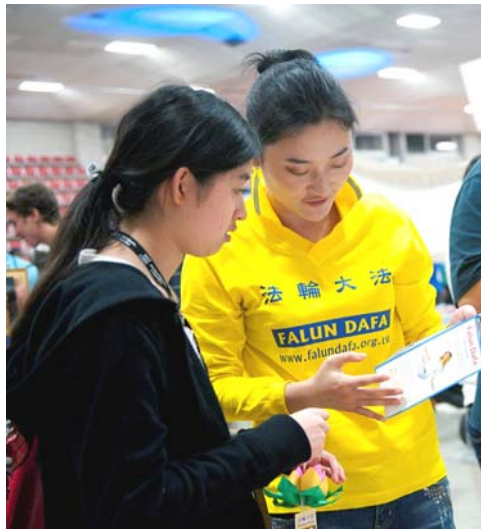
图: 法轮大法俱乐部成员在迎新活动中讲真相

当天下午,法轮大法俱乐部的成员二十多人在学校正门前的草坪集体炼功,成为一道亮丽的风景线。游客中有为数众多的从中国大陆来的,他们看到法轮功学员在草坪上自由地炼功后,非常震惊;有些大陆游客表示他们在台湾、香港等也曾看到法轮功学员集体炼功的场景。◇