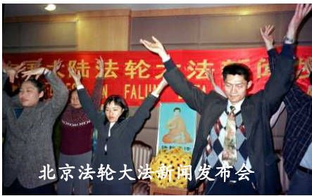
北京法轮大法新闻发布会

1999年7月，中共公开迫害法轮功，一时间如乌云盖顶，全国，甚至全世界泛滥的都是江氏政治流氓集团诬陷法轮功的谎言。为维护法轮大法，澄清谎言，许许多多大法修炼者前赴后继前往北京和平请愿，与此同时，在同年10月28日，30多名法轮大法修炼者，不畏生死，在北京郊区成功召开法轮大法新闻发布会，第一次使世界媒体对大陆大法修炼者有了直接的正面了解。事后，国外媒体的报导中写到：北京法轮大法新闻发布会是在江泽民脸上的一记响亮的耳光。