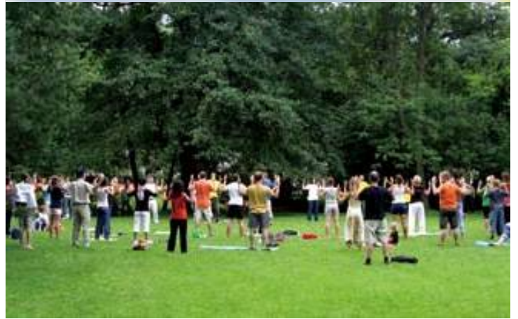
上图 波兰法轮功学员在户外集体炼功

在法轮功传世 19 年之后，特别是在法轮功经历了中共恶党 12 年的疯狂迫害之后，世人惊奇的发现——法轮功不仅没有倒下，反而迅速传遍全球。对于经历过中共无数次政治运动的中国人来讲，这是一个值得深思的奇特现实。