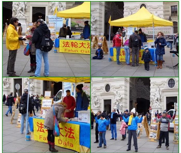
■ 维也纳闹市区的米歇尔勒广场上的讲真相弘法活动

奥地利国会议员、阿姆施泰滕市副市长克涅格斯伯格·路德维希女士来函表示：“一个人的尊严是不可侵犯的。