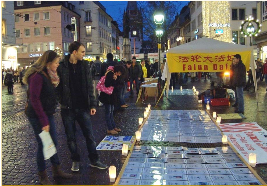
德国弗莱堡市中心，人们纷纷驻足了解法轮功真相

【明慧网】二零一一年十二月十日，德国弗莱堡市中心的一场烛光守夜活动，吸引了摩肩接踵的人群，这是德国法轮功学员们谴责中共迫害法轮功，纪念世界人权宣言颁布六十三周年的活动。