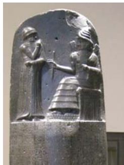
图：人类第一部法典“汉谟拉比法典”，上部浮雕为汉谟拉比从太阳神手中接过权杖，启示人们法律是神赋予人类的，用以维护人间的公平与正义。

中共每次掀起血腥运动时，都会利用那些接受了它谎言的人充当凶手和替罪羊，中共则永远标榜自己“伟大、光荣、正确”。例如“文革”