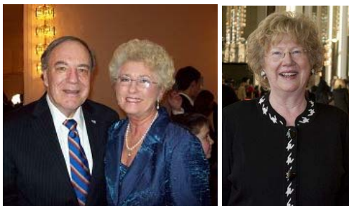
左图：美国联邦教育部长阿尼·邓肯偕夫人凯伦与子女观看神韵