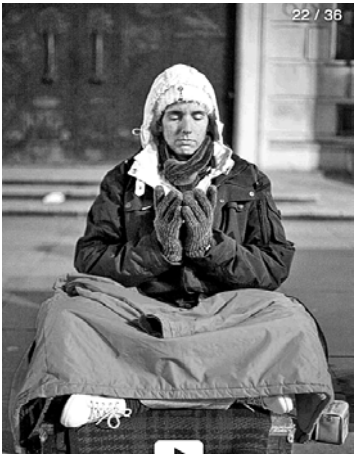
■ 菲尔·歌勒拍摄的法轮功学员

菲尔·歌勒是一位住在伦敦的法国摄影师。今年 3 月 6 日至 7 日，他连续 24 小时跟踪拍摄了当日在领馆前的六位法轮功学员，每小时照一张。最后他把这二十四张照片收