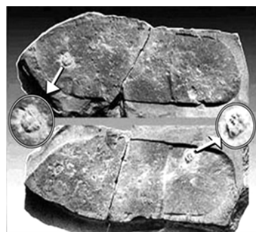
踩在三叶虫上的远古鞋印

1968 年 6 月，美国的一位业余化石爱好者米斯特在犹他州的羚羊泉附近，找到了几块三叶虫的化石。当他用地质锤轻轻地敲开一块石片时，它像书本一样打开了。他看到了令人吃惊的现象：被敲开的石片中，有一片上有一个人的脚印，脚印中央踩着几只三叶虫；另一片上也显现出几乎完整无缺的人的脚印形状。从这两个脚印还可以看出，留下脚印的人们都穿着便鞋！米斯特凭借自己的考古知识，意