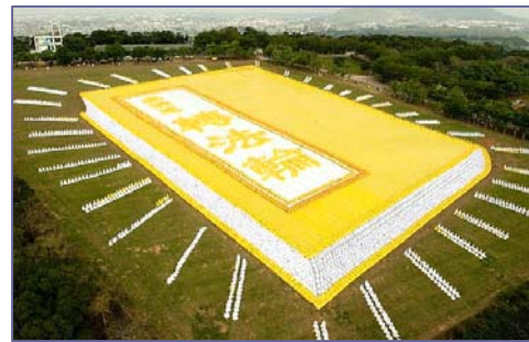
二零零九年十一月二十一日，亚洲法轮大法修炼心得交流会在台湾召开前夕，在台湾台中县外埔乡“台湾省农会休闲综合农场”面积达十公顷的青青草原，来自亚太国家约六千多名法轮功学员排组出巨幅《转法轮》书籍的立体画面。

法轮大法创始人及法轮功也因对人类、对社会强大的正面作用，在世界各国广受赞誉，至今法轮大法已经获得各国各地政府褒奖1632项，支持议案313件；至2010年，法轮大法已经传遍世界100多个国家和地区，法轮功的主要书籍《转法轮》被译为30多种语言在全世界发行，并可在互联网上免费下载。