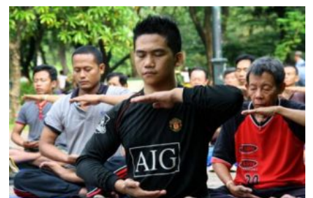
图为法轮功学员在雅加达国家纪念碑公园炼功

文章说, 法轮功在印尼蓬勃发展, 已传播到至少十五个省, 在雅加达和巴厘岛有几十个炼功团体。