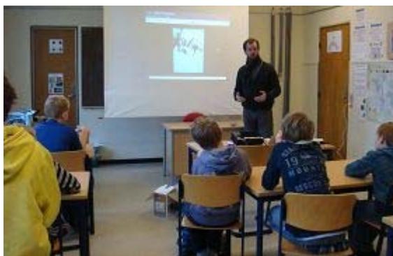
在丹麦 Hammerum Friskole 学校的课堂上介绍法轮功

学员用通俗易懂的语言, 向孩子们讲法轮大法的美好。“做个好孩子就要讲真话, 虽然有时候可能很困难, 比如做错事时, 要承认自己做错了。”“对爸爸妈妈, 兄弟姐妹, 同学老师, 所有的人都要友善。”