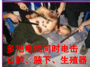
多把电棍同时电击 口腔、腋下、生殖器