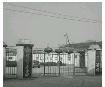
邢台市第二看守所，洗脑班就在正门口的大楼上

综上所述，所有参与迫害者至少犯了刑法第 399 条滥用职权罪；刑法 238 条非法拘禁罪；刑法 245 条非法侵入住宅罪；刑法 251 条非法剥夺公民信仰自由罪；刑法 263 条抢劫罪；索贿罪等。这些罪恶早晚会计诸法律，所有作恶者将难逃法律严惩！◇