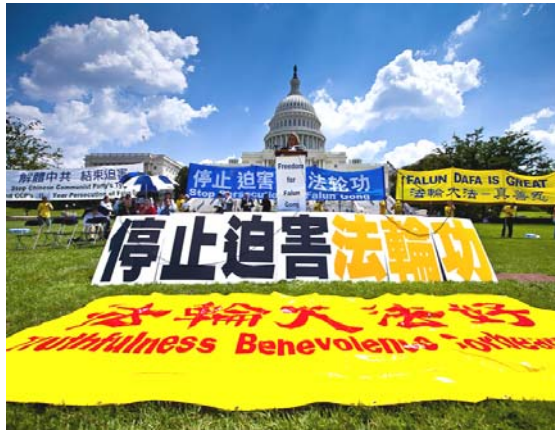
2010 年 7 月 22 日, 在美国首都华盛顿国会山庄西草坪上, 来自世界各地的三千多名法轮功学员举行了“七·二零”反迫害集会。

【明慧网】香港《前哨》杂志 2011 年 2 月刊大陆报导栏目中的头条文章, 即总第 240 期被列为封面的精选文章, 作者揭示了中共前党魁江泽民的自认告白, 文章题目是《江泽民终生后悔的两大事件》。江泽民自知死期不远, 2010 年起至少两次对身边的人谈到, 这一辈子做过两件愚蠢之事: 蠢事之一是美国轰炸南斯拉夫时, 下令中国大使馆不能撤退; 蠢事之二则是镇压法轮功。江泽民镇压法轮功, 为自己平添了几千万“敌人”, 这是他自己认为一辈子中所做的第二件大蠢事。