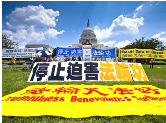
2010 年 7 月 22 日, 在美国首都华盛顿国会山庄西草坪上, 来自世界各地的三千多名法轮功学员举行了“七·二零”反迫害集会。

迫害法轮功的决定从一开始就在中央政治局常委内部引起争议。朱镕基、李瑞环认为, 对于一种“气功”