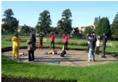
图：在剑桥大学公园里晨炼