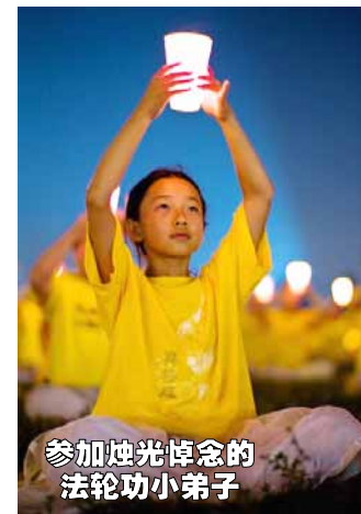
参加烛光悼念的 法轮功小弟子