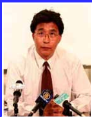
韩广生 原 沈阳市司法 局局长