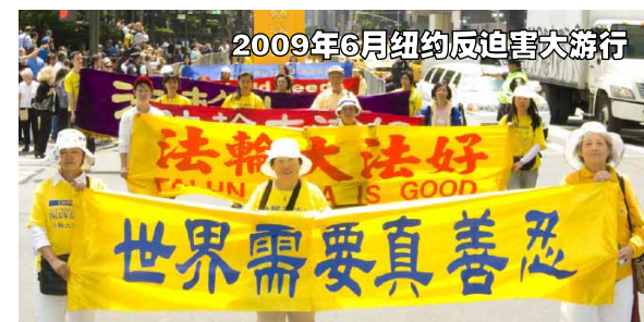
2009年6月纽约反迫害大游行