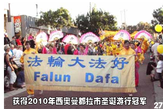
获得2010年西奥曼都拉市圣诞游行冠军