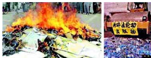
迫害伊始中共大量销毁法轮功书籍

看遍法轮功的书籍和录像，没有一句“不准学员吃药”的话。法轮功创始人李洪志先生只是讲了吃药与修炼的关系。李洪志先生在讲法录像中提到，法轮功学员不可以用气功去给别人治病。（可参见《转法轮》249页“法轮大法的真修弟子谁也不能给人治病”）