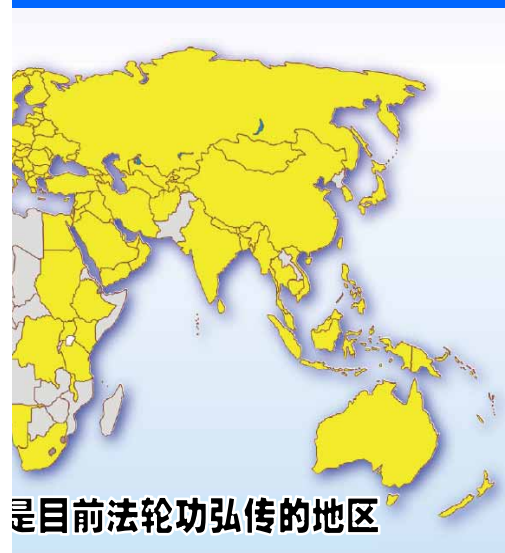
是目前法轮功弘传的地区

退党服务中心在世界各地大城市成立。在海外各大旅游景点的退党服务点，一批又一批的大陆游客明白了真相，并声明“三退”。