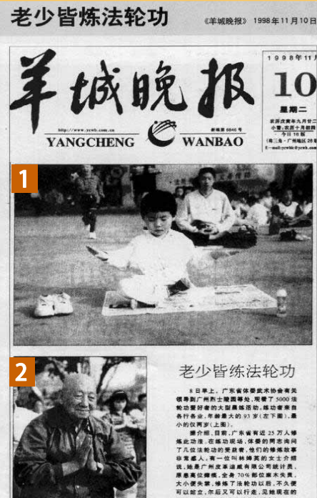
▲1998年《羊城晚报》报道：“11月8日早上，广东省体委武术协会有关领导到广州烈士陵园等处，观看了5000法轮功爱好者的晨练活动。炼功者来自各行各业，年龄最大的93岁(图2)，最小的仅两岁(图1)。据介绍，法轮功强调义务教功，不收费。目前，广东省有近25万人修炼此功法。”

月31日刊登专题报道《法轮功修心健身走俏鹏城 三千学员修炼乐此不疲》。该报道介绍：法轮功各站、点的义务组织炼功学法，松散管理，不搞经济实体和行政机构，不存钱物、禁止收费收礼，不搞治病活动。学员炼功以自发为主，以修炼心性为本，加上健身治病效果明显，因此得到了许多人的青睐。1995年深圳荔枝公园设立了第一个法轮功炼功点，当时只有40人，到1998年为止，全市五区学法轮功的人数已逾三千多人，共有68个炼功点。