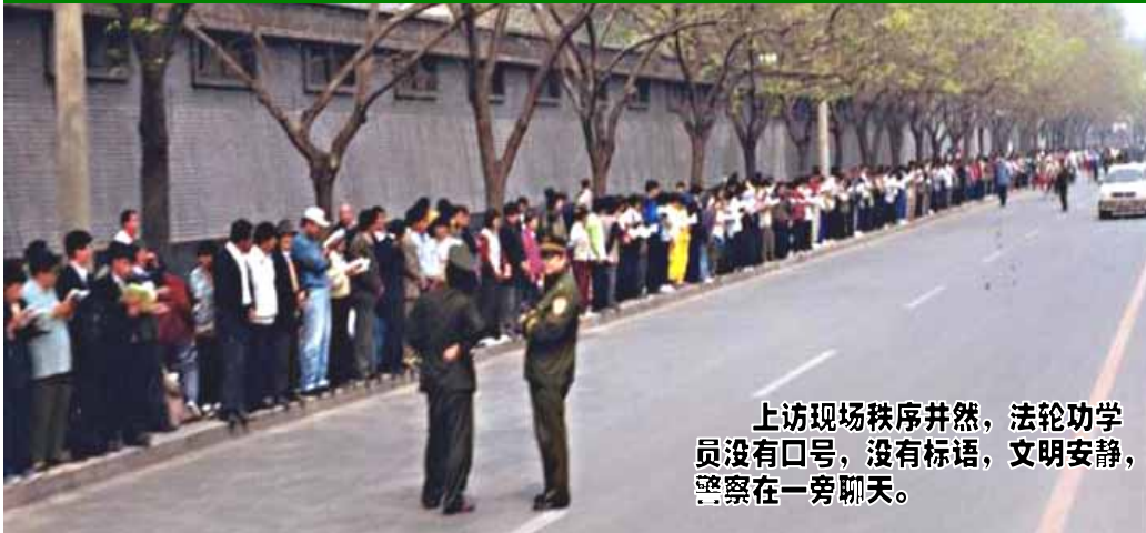
上访现场秩序井然，法轮功学员没有口号，没有标语，文明安静，警察在一旁聊天。