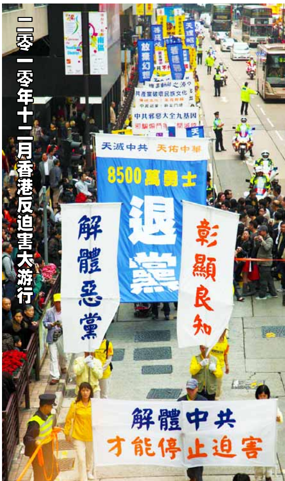
二零一零年十二月香港反迫害大游行

2004年11月，揭露中共“假恶斗”本质的《九评共产党》一书横空出世，一直在大陆民间热传，并在海内外引起强烈震撼。