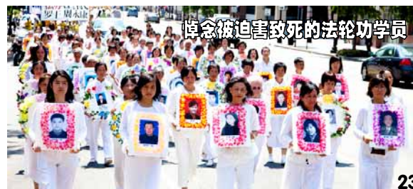
悼念被迫害致死的法轮功学员