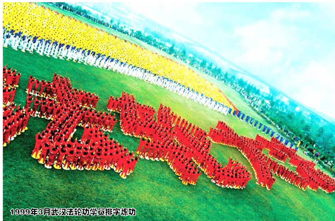
1999年3月武汉法轮功学员排字炼功