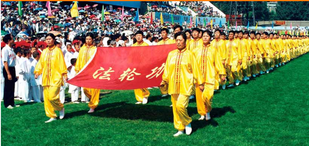
▲1998年8月20日，法轮功学员在沈阳亚洲体育节开幕式上入场。8月28日《中国青年报》刊载《生命的节日》一文对参加该体育节的法轮功学员做了报道。