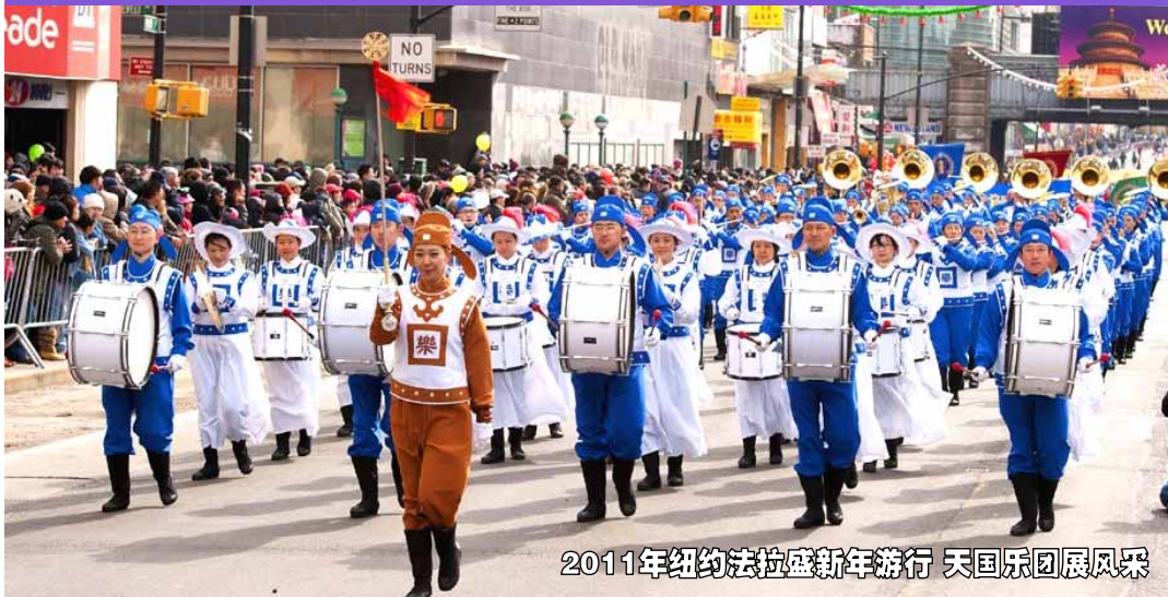
2011年纽约法拉盛新年游行 天国乐团展风采

气势恢宏的天国乐团、壮丽的花车、雄壮的腰鼓队、优雅的仙女、喜庆的舞龙舞狮，法轮功学员的游行队伍已经成为世界各大游行庆典中的明星。在很多游行中，法轮功学员作为唯一的华人队伍受到邀请参加，并多次获得褒奖，受到各地民众的喜爱。