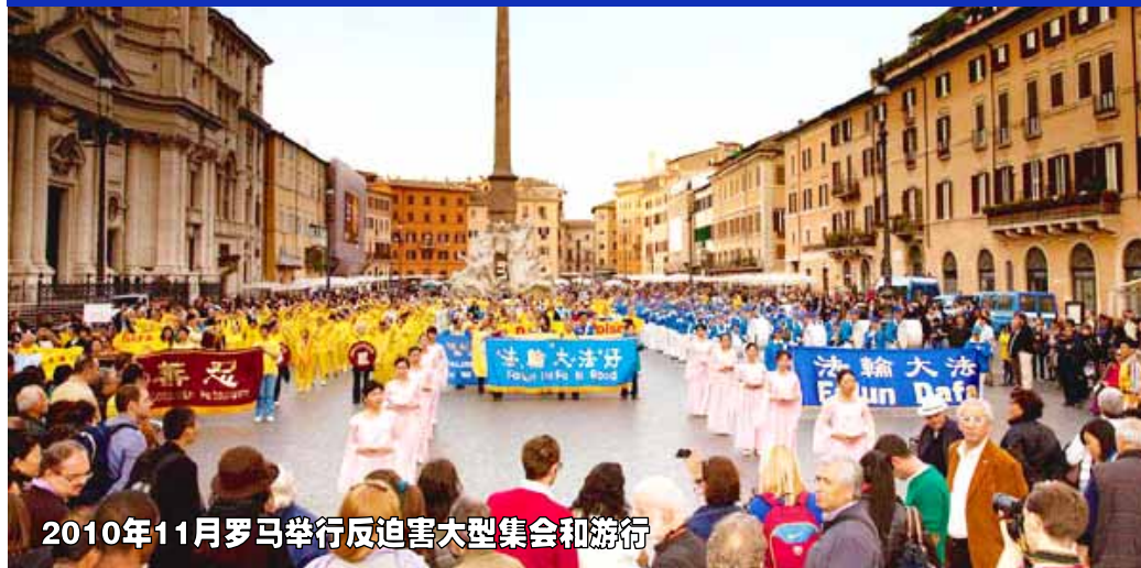
2010年11月罗马举行反迫害大型集会和游行

为了制止迫害,为了唤醒良知,每年世界各地的法轮功学员都要举行反迫害集会和大游行。