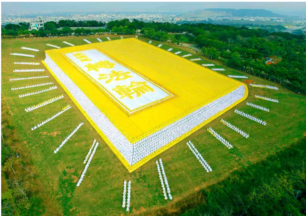
2009年11月，六千多名亚太地区的法轮功学员在台中外埔乡农场草原上，排出巨型《转法轮》。