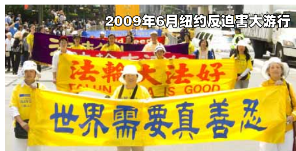
2009年6月纽约反迫害大游行