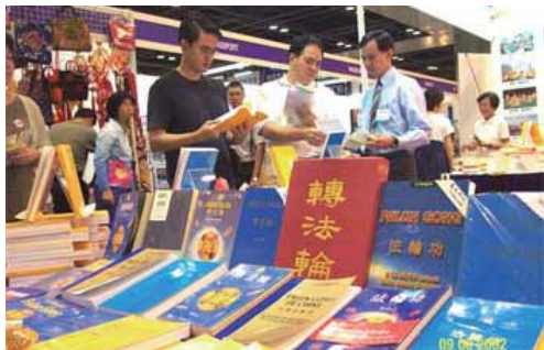
法轮功的书籍在2002年新加坡国际书展上展出