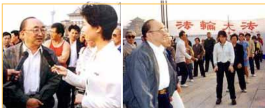
▲1998年5月15日晚10时，中央电视台在第一套节目“晚间新闻”和第五套节目中分别报道了国家体育总局伍绍祖局长视察长春，广大群众修炼法轮功的盛况。