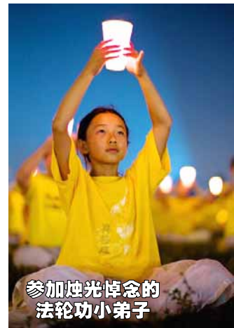
参加烛光悼念的 法轮功小弟子