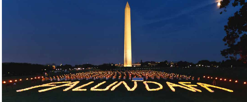
▲2010年7月22日晚，世界各地的一千多名法轮功学员来到美国首都华盛顿纪念碑前举行烛光悼念。

1999年7月20日，中共开始了对法轮功学员群体灭绝式的迫害。面对着腥风血雨，法轮功学员们没有退缩，他们用和平对抗暴力，用理性揭露谎言，用生命捍卫了真理，用坚忍不屈的精神铸就了中华民族的道德丰碑。