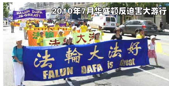
2010年7月华盛顿反迫害大游行

游行展示了十一年反迫害中法轮功学员一如既往的平和、善良的精神风貌,以及制止迫害的强大信心。声势浩大的游行队伍震撼人心,吸引无数路人驻足观看,人们纷纷索要资料了解法轮功真相,很多人表示对法轮功反迫害的支持。