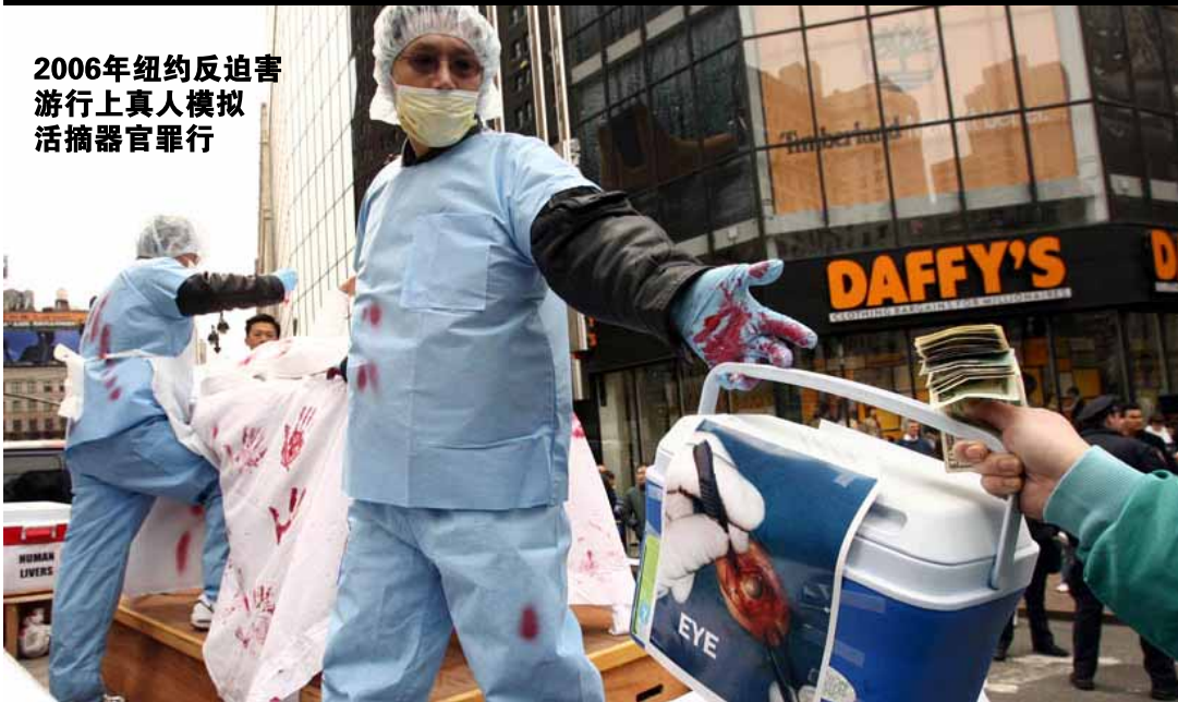
2006年纽约反迫害游行上真人模拟活摘器官罪行