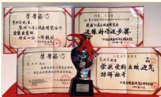
▲在1993年北京健康博览会上，法轮功被授予大会唯一的最高奖——“边缘科学进步奖”，李洪志先生荣获“受群众欢迎气功师”称号。

1998年，国家体育总局组织北京、武汉、大连及广东省的医学界专家，对近三万五千名法轮功学员做了五次医学调查。调查表明，修炼法轮功祛病健身的有效率高达98%以上，其中痊愈及基本康复率在75%以上，被调查者的心理和精神状况也得到极大改善。