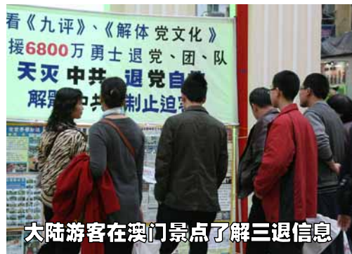
大陆游客在澳门景点了解三退信息