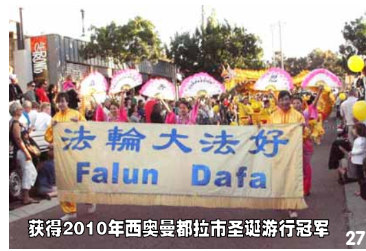
获得2010年西奥曼都拉市圣诞游行冠军