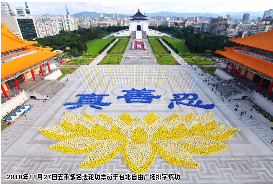
2010年11月27日五千多名法轮功学员于台北自由广场排字炼功