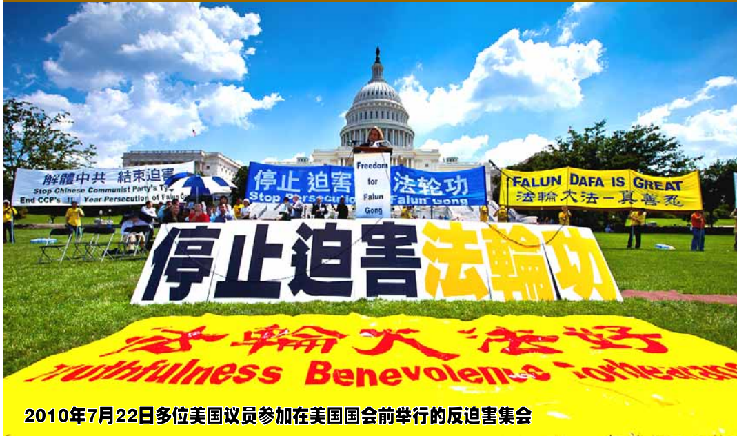
2010年7月22日多位美国议员参加在美国国会前举行的反迫害集会