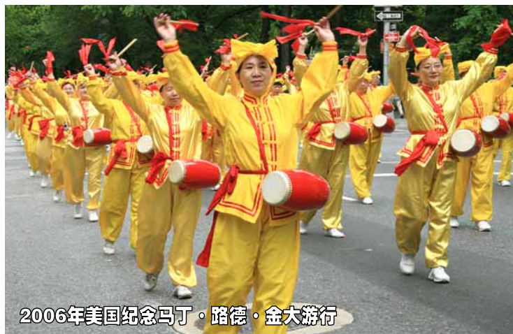
2006年美国纪念马丁·路德·金大游行