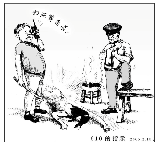
610 的指示 2005.2.15