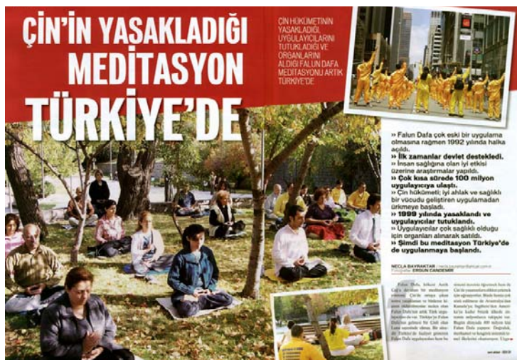
图：土耳其著名杂志《新当代》介绍法轮功以及中共对法轮功的残酷迫害

文章写道，由于中国大陆在短短七年的时间里学炼法轮功的人数达到了近亿人，远远超过了中共党员的人数，使得中共政权既恐惧又嫉妒，因此于一九九九年七月开始了对法轮功学员的血腥迫害。