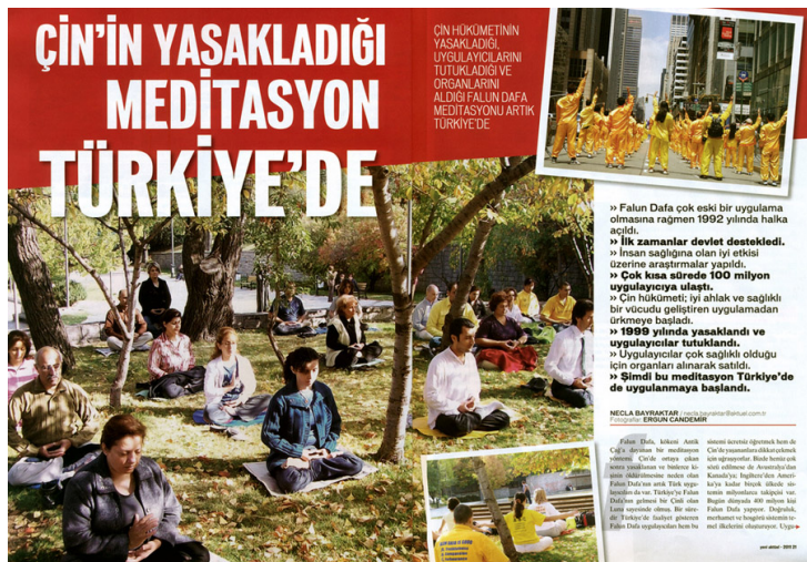
图：土耳其著名杂志《新当代》介绍法轮功以及中共对法轮功的残酷迫害