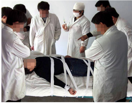
酷刑演示: 打毒针 (注射不明药物)