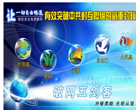
最有效、应用最广的翻墙软件

自由门，是中国大陆网民最为熟悉的一种突破网络封锁软件。二零零九年五月，哈佛大学伯克曼互联网中心发出一份报告，对十种不同的破网软件进行了全面测试和技术分析。该报告对自由门以及无界浏览，都给以极高的评价。其中自由门的速度快，而无界浏览安全性强，成为获得较好评价的主要原因。