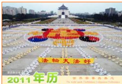
2011 年年历：世界需要真善忍

同事感慨的说：“我想做点善事，前些年我有一位亲戚找我为佛教捐款，说捐的越多功德越大。我捐了两千元。后来发现我捐的钱都变成了他的服装。我们农村老家的大队说是搞建设，谋发展，