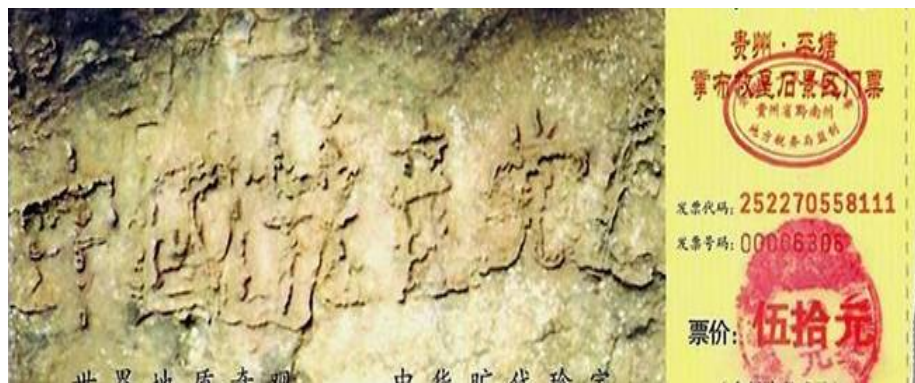
2002 年 6 月，在贵州省平塘县掌布乡发现了一块大约有 2.7 亿年历史的藏字石，天然形成“中国共产党亡”。

你在入党、团、队的时候宣誓说：“为共产主义奋斗终生”。你的这个毒誓一发出，就在你的身上打上了印记，它要跟你一生的。你必须公开声明退出才能够除去这样的印记，即毒誓，你才能够平安的度过灾难。