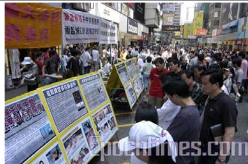
香港法轮功学员的真相点