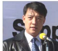
前天津 610 官员 郝凤军