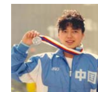
前奥运游泳名将 黄晓敏