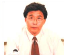
前沈阳市司法局长 韩广生