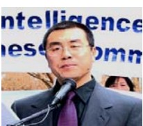
前国安部对外情报官李凤智