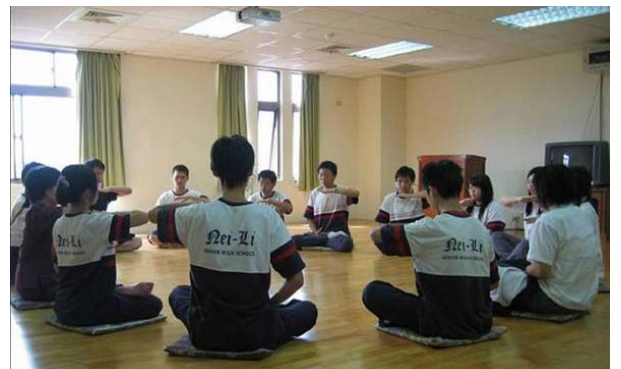
▲国立内坌高中成立近十年，教师法轮功社团成立也已届八年。图为学生一起利用午休时间习炼法轮功。

法轮大法（法轮功）自 1992 年 5 月传出以来，迄今已弘传世界 100 多个国家和地区，修炼者涵盖大学教授、医生、律师、工程师、公务员、军警、士农工商、学生、家庭主妇等各阶层，仅台湾一地，就有一千多个炼功点，遍及全台湾三百多个乡镇，连外岛的澎湖、金门、马祖都有十几个炼功点。