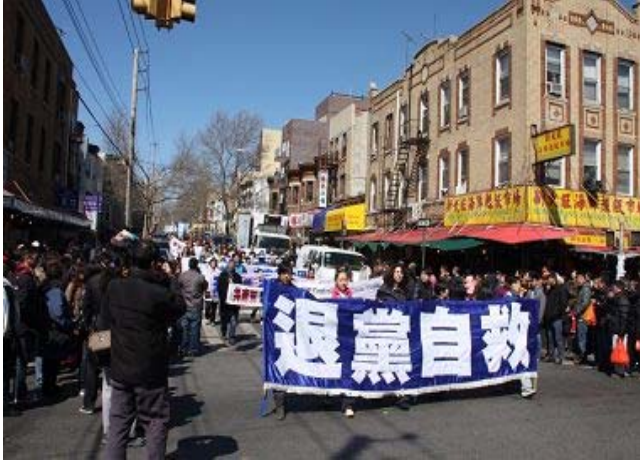
■ 纽约布碌伦唐人街游行，声援九千多万中国民众退出中共及相关组织

（明慧记者采菊纽约报道）二零一一年三月二十七日星期日，中国人民退出中共党、团、队（三退）的人数即将突破九千二百万之际，纽约各界人士在布碌伦的唐人街举行盛大游行集会，祝福这九千多万伟大的生命，唤醒更多华人同胞尽快脱离邪党走向光明与新生。