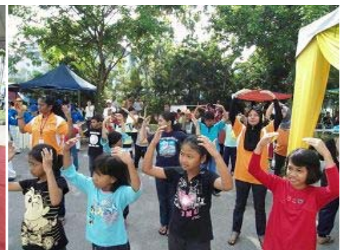
■左图/天国乐团的队员们演示了法轮功五套优美的功法 右图/大人孩子们自发地学炼法轮大法的功法