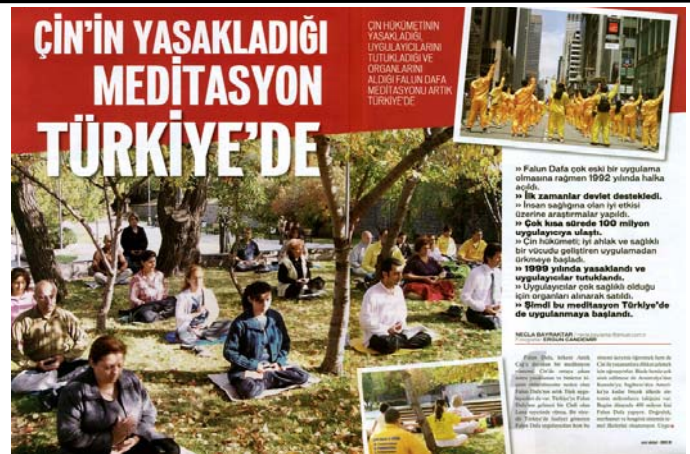
图：土耳其著名杂志《新当代》介绍法轮功以及中共对法轮功的残酷迫害