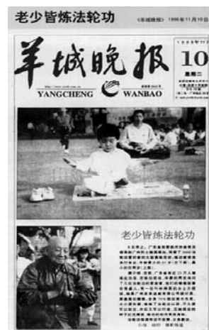
《羊城晚报》1998年11月10日报道：“老少皆炼法轮功”

1998年下半年以乔石为首的部份人大离退休老干部对法轮功进行了数月的详细调查，得出“法轮功于国于民有百利而无一害”的结论，并于年底向中共中央政治局提交了调查报告。◇