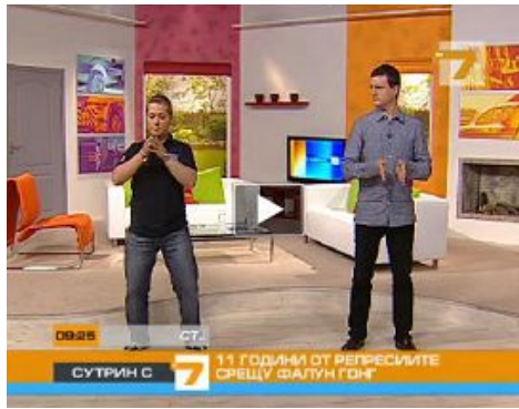
保加利亚西人法轮功学员（左）为主持人和观众演示功法

二零一零年七月二十日，在法轮功学员反迫害十一周年之际，保加利亚国家电视 7 台的晨间节目，特邀两位西人法轮功学员在节目中介绍法轮功。学员在现场直播的节目中，为主持人和观众示范功法，并呼吁制止中共迫害。