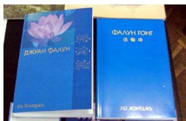
保加利亚文《转法轮》和《法轮功》

二零零五年五月二十八、二十九日，保加利亚最大的图书展在首都索菲亚的国家文化宫（The National Palace of Culture）举行，法轮功学员带着保加利亚文《转法轮》参加了该次图书展。《转法轮》成为书展上最引人瞩目的书籍之一。◇