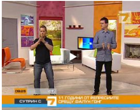
保加利亚西人法轮功学员（左）为主持人和观众演示功法

二零一零年七月二十日，在法轮功学员反迫害十一周年之际，保加利亚国家电视7台的晨间节目，特邀两位西人法轮功学员在节目中介绍法轮功。学员在现场直播的节目中，为主持人和观众示范功法，并呼吁制止中共迫害。