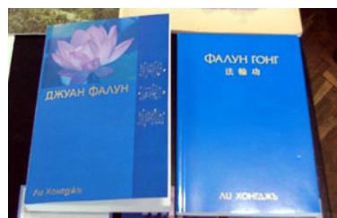
保加利亚文《转法轮》和《法轮功》

二零零五年五月二十八、二十九日，保加利亚最大的图书展在首都索菲亚的国家文化宫（The National Palace of Culture）举行，法轮功学员带着保加利亚文《转法轮》参加了该次图书展。《转法轮》成为书展上最引人瞩目的书籍之一。◇