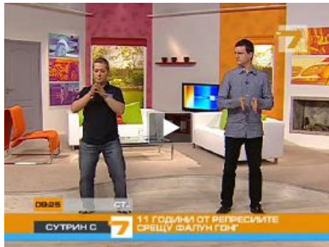
■ 保加利亚西人法轮功学员（左）为主持人和观众演示功法

二零一零年七月二十日，在法轮功学员反迫害十一周年之际，保加利亚国家电视 7 台的晨间节目，特邀两位西人法轮功学员在节目中介绍法轮功。学员在现场直播的节目中，为主持人和观众示范功法，并呼吁制止中共迫害。