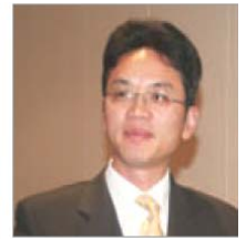
前驻悉尼外交官 陈用林