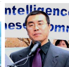
前国安部对外情 报官 李凤智