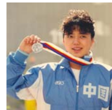
前奥运游泳名将 黄晓敏