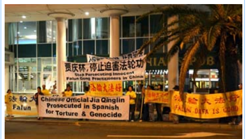
图：法轮功学员在珀斯喜来登酒店对面抗议贾庆林迫害法轮功

贾庆林是被“追查迫害法轮功国际组织”追查的十一个直接参与推动对法轮功学员迫害的中共中央官员之一，也是西班牙国家法庭以“群体灭绝罪”及“酷刑罪”起诉的五名迫害法轮功的元凶之一。