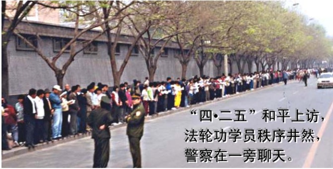
“四·二五”和平上访， 法轮功学员秩序井然， 警察在一旁聊天。