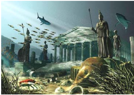
图：大西洲的故事，也是历史上惨痛教训的一页。图为艺术家绘制的大西洲（亚特兰蒂斯）海底遗迹。