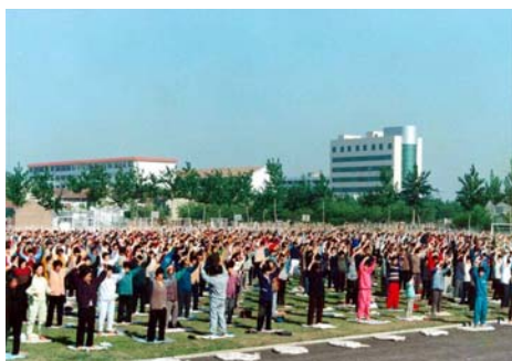
历史图片：1998 年秋，山东潍坊市奎文区 2000 多人在白浪河畔的体育场炼法轮功。

第一遍《转法轮》我学了整整半个月，随着一天天看《转法轮》，我的腿一天天在消肿，看完后也没那么痛了，我慢慢试着下地，哎，竟然能走了！我马上打电话请他同事来教我炼功。一个月后，腿基本恢复正常，我便去上班，领导和同事们都很惊讶：“你不是半月板坏了得做手术吗？怎么治的？怎么这么快就能上班了？”“学《转法轮》、炼法轮功