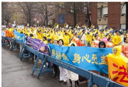
千余名法轮功学员和支持民众在纽约法拉盛举行集会，纪念“四·二五”

【明慧网二零一一年四月二十六日】（明慧记者采菊纽约报道）二零一一年四月二十三日午，千余名法轮功学员和支持民众在纽约法拉盛，举行了声势浩大的游行，游行之后又召开了盛大集会，纪念法轮功学员一九九九年四·二五北京中南海和平请愿十二周年。