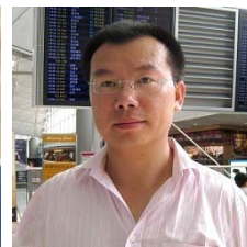
前人民日报人民 论坛副主任 邱明伟