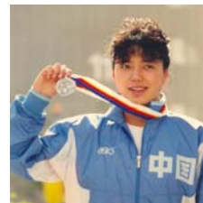
前奥运游泳名将 黄晓敏