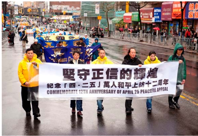
■纪念“四·二五”十二周年,法轮功学员在纽约法拉盛举行大游行

队伍分为三部份:开篇是“大法洪传”,由天国乐团开路。雄壮的乐曲犹如千军万马响彻在法拉盛华人最热闹的缅街上空。接下来是“中原蒙难”,肃穆的法轮功学员捧着被迫害致死的同修的照片,叙述着法轮功学员不畏强权,坚守真理,惊天地泣鬼神的传奇。第三部份是“三退保平安”,各方民众欢呼雀跃,争先恐后地退出中共党团队,为自己的生命开创着最美好的未来。