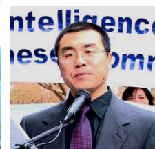
前国安部对外情 报官 李凤智