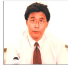
前沈阳市司法局 局长 韩广生