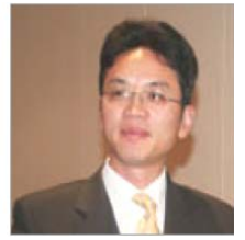
前驻悉尼外交官 陈用林