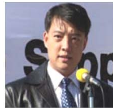
前天津 610 官员 郝凤军