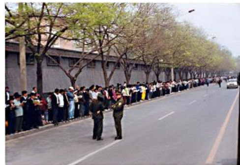
图: 99年4月25日法轮功学员静静等待着向国务院信访办反映情况

四月二十五日清晨六点多钟, 我和老伴去国务院信访办上访, 一下车我们都惊呆了, 西安门大街人行道两边已站满法轮功学员, 还有许多学员