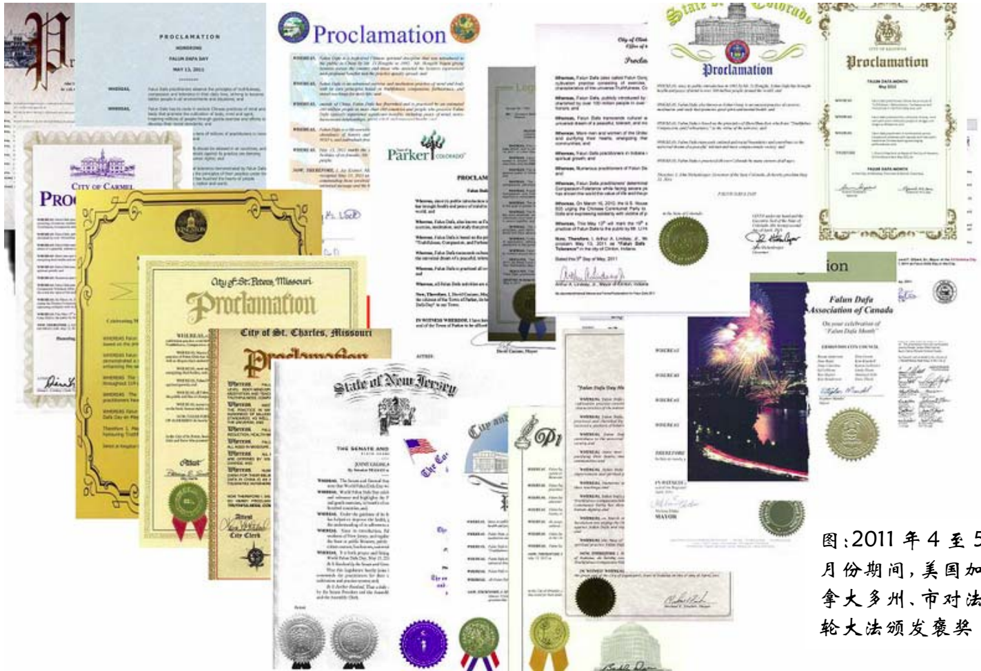
图：2011 年 4 至 5 月份期间，美国加拿大多州、市对法轮大法颁发褒奖

1992 年 5 月 13 日，李洪志先生在中国吉林长春首次将法轮大法传出。法轮大法又称法轮功，是以“真善忍”为根本指导、性命双修的佛家上乘修炼大法。当时，中国大陆估计有数万人参加了李洪志先生的面授班。此后，法轮功通过人传人、心传心的方式，传遍了大江南北。现在，法轮功已传遍了亚洲、欧洲、美洲、大洋洲、非洲 100 多个国家和地区，受到褒奖三千多项。无论来自哪个国家和民族，无论男女老幼，只要