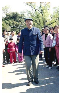
图：老人扔下拐杖，走了几圈

其中有一位六十多岁的高级工程师，患脑血栓，拄着拐杖坐在椅子上。师父对他说：“把拐杖扔掉，椅子撤下去。”老人听了，慢慢站起来，撤下椅子，扔掉拐杖，试着迈腿，然后在礼堂门前走了几圈，他高兴地笑，又激动地哭。在场的人目睹这神奇的一幕，无不惊叹：“神了！”老人自己上台走进礼堂听课，从此不用拐杖，能自己走路了。他老伴当晚给师父写感谢信，代表全家感谢师父，决心炼好法轮功，报答师父的恩德。这样的事有很多，说也说不完。（选摘自明慧网文章《法光照耀吉林大学》）◇