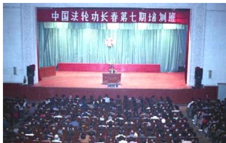
图：长春第七期法轮功传法班

师父讲课前，做接待工作的学员按照一贯做法，把礼堂使用须知和注意事项，比如不迟到不早退、不随地扔纸等等，写在一张小纸条上，交给师父。这位学员刚得法，以为法轮功