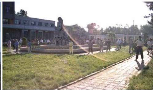
图：吉林大学科技楼炼功点