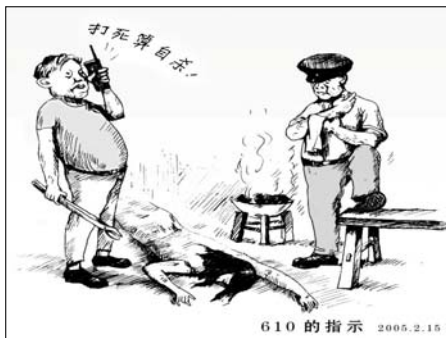
“610”的指示——打死算自杀

【明慧网】中共迫害法轮功学员，其家属到派出所要人，并指出警察违法时，警察时常说：“上面叫我们抓就抓，错了归上面负责，你们可以去告。”摆出一幅蛮横无理的姿态，好象这些警察做错了什么，自己也不会承担任何责任。“上面”是谁？错了真的归“上面”负责而当事人没有任何责任吗？