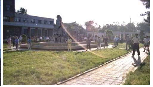
图：吉林大学科技楼炼功点