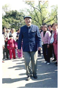
图：老人扔下拐杖，走了几圈

其中有一位六十多岁的高级工程师，患脑血栓，拄着拐杖坐在椅子上。师父对他说：“把拐杖扔掉，椅子撤下去。”老人听了，慢慢站起来，撤下椅子，扔掉拐杖，试着迈腿，然后在礼堂门前走了几圈，他高兴地笑，又激动地哭。在场的人目睹这神奇的一幕，无不惊叹：“神了！”老人自己上台走进礼堂听课，从此不用拐杖，能自己走路了。他老伴当晚给师父写感谢信，代表全家感谢师父，决心炼好法轮功，报答师父的恩德。这样的事有很多，说也说不完。（选摘自明慧网文章《法光照耀吉林大学》）◇