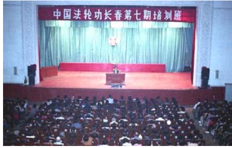
图：长春第七期法轮功传法班

师父讲课前，做接待工作的学员按照一贯做法，把礼堂使用须知和注意事项，比如不迟到不早退、不随地扔纸等等，写在一张小纸条上，交给师父。这位学员刚得法，以为法轮功