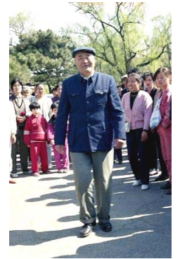
图：老人扔下拐杖，走了几圈

其中有一位六十多岁的高级工程师，患脑血栓，拄着拐杖坐在椅子上。师父对他说：“把拐杖扔掉，椅子撤下去。”老人听了，慢慢站起来，撤下椅子，扔掉拐杖，试着迈腿，然后在礼堂门前走了几圈，他高兴地笑，又激动地哭。在场的人目睹这神奇的一幕，无不惊叹：“神了！”老人自己上台走进礼堂听课，从此不用拐杖，能自己走路了。他老伴当晚给师父写感谢信，代表全家感谢师父，决心炼好法轮功，报答师父的恩德。这样的事有很多，说也说不完。（选摘自明慧网文章《法光照耀吉林大学》）◇