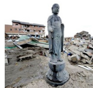
2011 年 3 月 11 日日本宫城县名取市，一尊地藏菩萨像矗立在被海啸摧毁的废墟上。

几年后，海啸再次向日本冲来时，人们从录像中惊恐的看到，海啸就像无数狂奔的疯狂的野牛，势不可挡，所过之处，汽车、货船、军用飞机、建筑物瞬间被吞没卷走。在无情的海啸面前，人类是那样的无能，渺小。