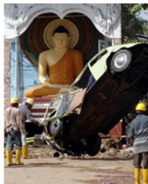
斯里兰卡加勒寺庙前，佛像在海啸中丝毫无损。

几年前，令人惊悚的南亚海啸，瞬间卷走了几十万人的生命。在海啸留下的一片残垣废墟中，人们意外的发现竟有佛像安然不动，丝毫无损。