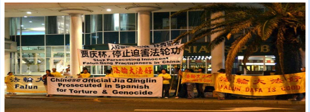
图：法轮功学员在珀斯喜来登酒店对面抗议贾庆林迫害法轮功

贾庆林是被“追查迫害法轮功国际组织”追查的十一个直接参与推动对法轮功学员迫害的中共中央官员之一，也是西班牙国家法庭以“群体灭绝罪”及“酷刑罪”起诉的五名迫害法轮功的元凶之一。