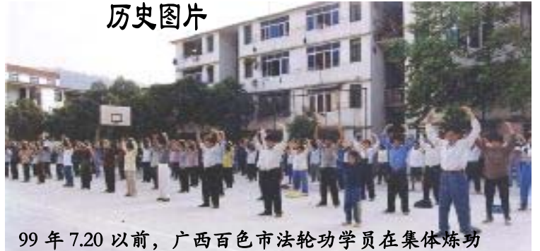
99 年 7.20 以前，广西百色市法轮功学员在集体炼功