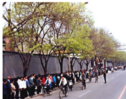
图：四·二五上访现场秩序井然

所以，就出现了四月二十五日全国万名法轮功学员到北京上访、要求放人的场面。其实，直到这时，法轮功学员还是本着相信政府的意愿去上访的，一切都是和平理性的，没有任何过激行为，但万万没有想到这次善意的上访，却成为独裁的当权者、政治小人江泽民利用手中权力迫害全国亿万法轮功学员的借口。◇