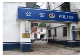
九江五里派出所 电话：0792—8587994