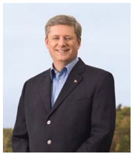
左图：法国巴黎学员庆祝法轮大法日；中图：加拿大多伦多学员庆祝法轮大法日；右图：加拿大总理哈珀